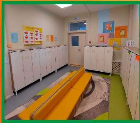
Перестановка мебели в приёмной

Внедрение улучшений: разработка алгоритмов (схем) расположения детской одежды в шкафу и последовательности одевания детей на прогулку