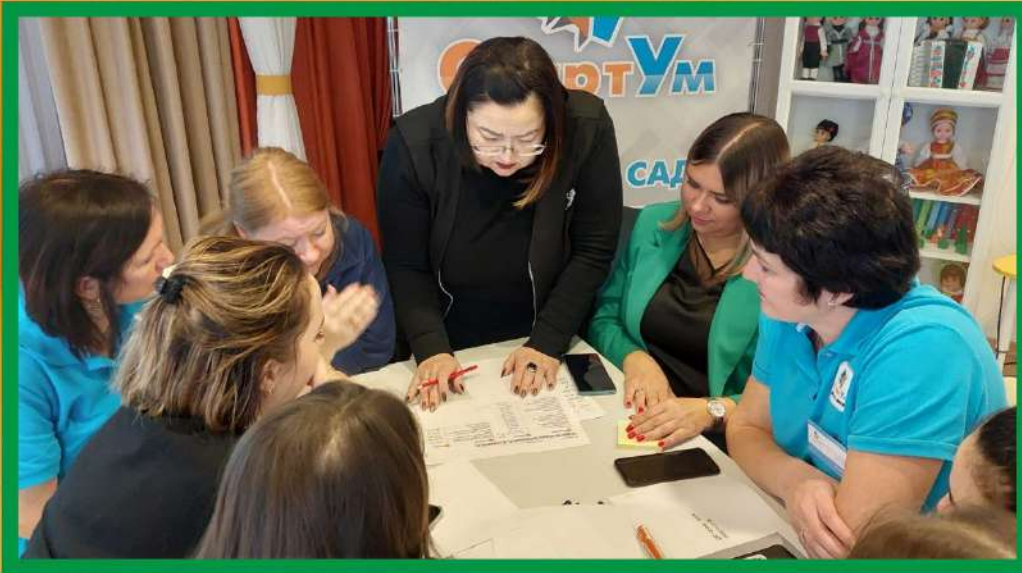
Заседание рабочей группы, разработка карт текущего и целевого состояния процесса, «дорожной карты» реализации проекта.